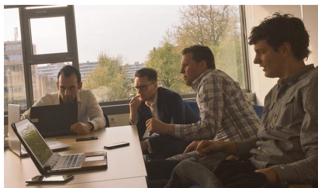
'PensioenUber van de Toekomst' CNV Utrecht