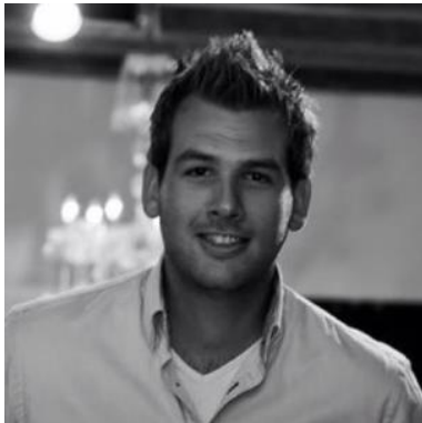
Frank Norda Syntrus Achmea Real Estate & Finance

Wij zijn zeven enthousiaste jongeren die het pensioenvirus hebben opgelopen. Gedurende een half jaar zijn wij tweewekelijks bij elkaar gekomen om de 'PensioenUber van de Toekomst' te bedenken. Al snel bleek dat er een probleem centraal stond voor ons: betrokkenheid. Ons doel is geworden om met CLOSE2ME die betrokkenheid te creëren. Dan zal ook, op termijn, het vertrouwen in de sector weer toenemen.